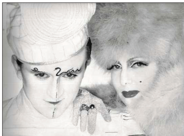
Рис. 12. http://www.theblitzkids.com/site_archive/saramandaia2002/hspic1sstre.JPG

Но, все-таки, наверное, только у «Culture Club» был безусловный творческий символ и это фронтмен группы Бой Джордж, а его символом были всевозможные шляпы. Изначально имидж андрогинно-эклектичного персонажа с уникальным голосом был и творческим образом Джорджа, его песни звучали свежо, было видно, что для него очень важно выглядеть именно так, что это и есть его сущность, его естество на тот момент. Но позже, как это часто бывает с повзрослевшими артистами, творческий образ, вероятно, уходит для Джорджа на второй