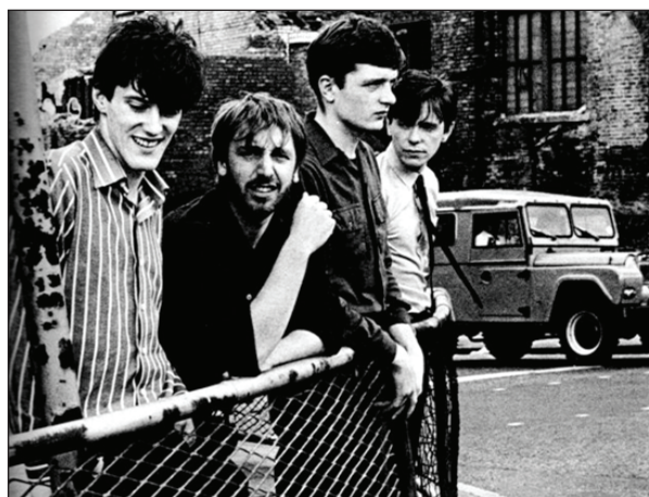
Рис. 3. http://www.ultimahora.com/adjuntos/161/imagenes/001/451/0001451188.jpg

Все это творчество и ради творчества происходят такие метаморфозы. Совершенно точно определил и истолковал понятие «творчество» Н. Бердяев в своем сочинении «Опыт эсхатологической метафизики». Для него творчество есть трансцендирование в преодолении данной действительности, детерминированности мира, замкнутости его круга. «В более глубоком смысле творчество есть победа над небытием. Творчество не есть только придание более совершенной формы этому миру, оно есть также освобождение от тяжести и раб-