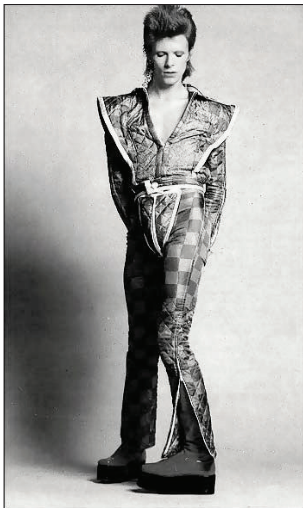
Рис. 2.

отказаться от социальных канонов, утвердить альтернативную жизненную позицию по отношению к ранее существующей и закрепить ее в различных социокультурных догмах. Молодежная субкультура, по мнению немецкого ученого Л. Хаузера, это «форма выражения процесса поиска и овладения мировоззрением». [1] Другими словами, молодежная субкультура — это особый способ жизненного поиска (Рис. 1).