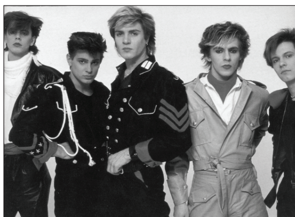
Рис. 14.