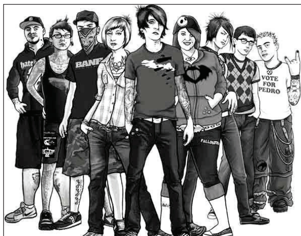
Рис. 1. http://900igr.net/datai/obschestvoznanie/Molodjozhnaja-subkultura/0001-001-Molodjozhnye-neformalnye-dvizhenija.jpg