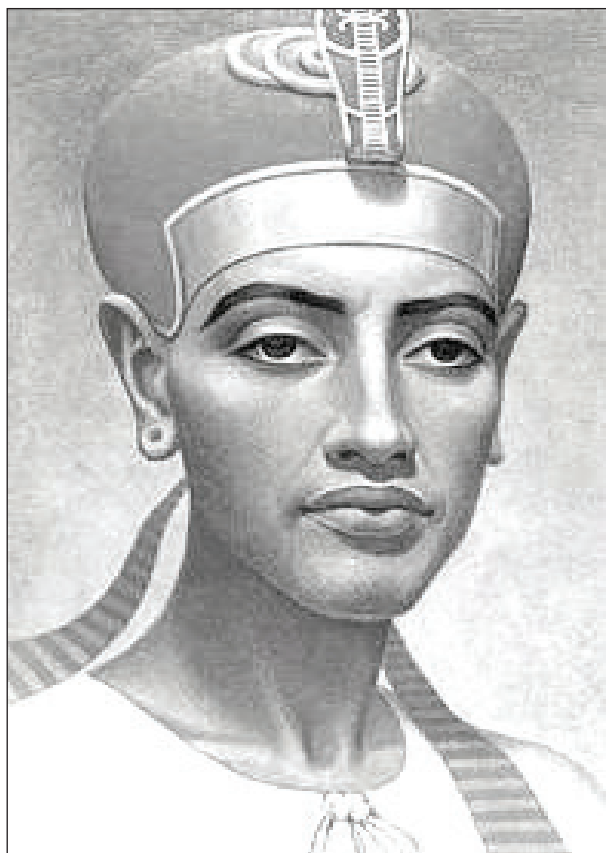
Рис. 5. Аменхотеп IV (Эхнатон (Угодный Атому)) http://onlainfilm.ucoz.ua/_ld/170/17028_16lgtqr.png

акт всегда вызывает образ иного, воображает в себе высшее, лучшее, более прекрасное, чем это, чем данное. Это возникновение образа иного, лучшего, более прекрасного есть таинственная сила в человеке и оно не объяснимо воздействием мировой среды». [5].