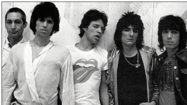
Рис. 7. http://cf.drafthouse.com/_uploads/galleries/23772/some-girls-image-1.jpg