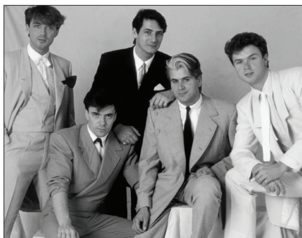
Рис. 13. http://ia.media-imdb.com/images/M/MV5BMjEyMDU4NTczOV5BMl5BanBnXkFtZTcwOTQ3NzQwOAA@._V1._SX640._SY503_.jpg