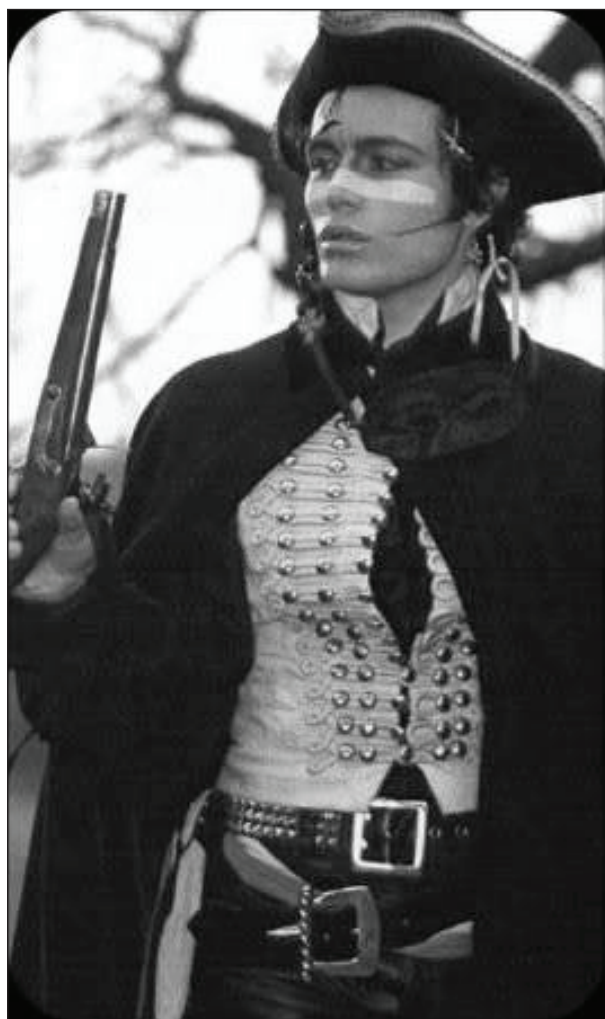
Рис. 10.