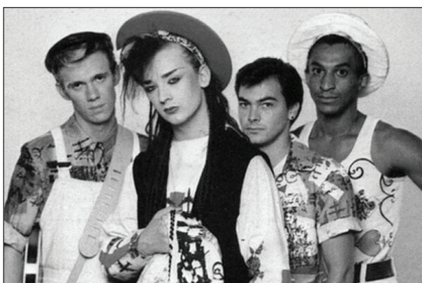
Рис. 11. http://media.rtl.fr/cache/nsGtgFI9f6zKFU_IENeQtA/795x530-2/online/image/2014/0109/7768649887_le-leader-de-culture-club-boy-george.jpg