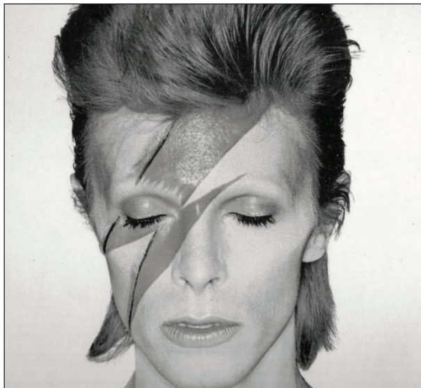
Рис. 8. http://t2.kn3.net/taringa/F/5/0/7/D/1/RingoZtar/310.jpg