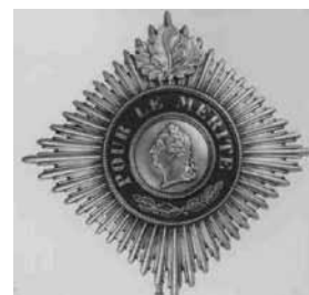
Звезда Большого креста ордена «Pour le Mérite». Без дубовых листьев. С дубовыми листьями.

листьями, РК с дубовыми листьями и мечами, РК с дубовыми листьями, мечами и бриллиантами, РК с золотыми дубовыми листьями, мечами и бриллиантами. Факт введения этих степеней Железного креста на смену «Pour le Mérite» свидетельствовал о необходимости в рамках наградной системы иметь исключительно высокую и почитаемую награду с рядом специфических функций, к которым можно отнести награждение нижних чинов, а не только офицеров и военачальников, как это было с орденом «Pour le Mérite».