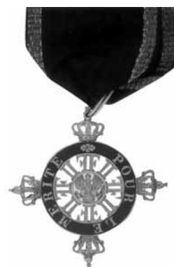
Знак ордена «Pour le Mérite» гражданского дивизиона

К 1819 г. количество награжденных орденом «Pour le Mérite» составляло 2 тыс. 460 чел. 12