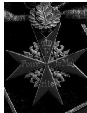
Знак ордена «Pour le Mérite» с дубовыми листьями на шейной ленте