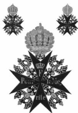
Бриллиантовые знаки ордена «Pour le Mérite»