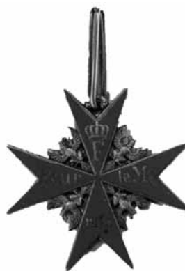
Знак ордена «Pour le Mérite»